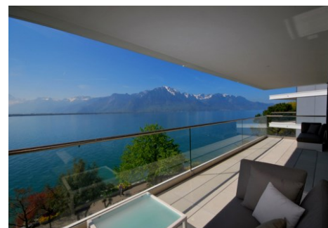
Vue extérieure balcon

Une réalisation d'un atelier d'architecture indépendant, au service de ses clients