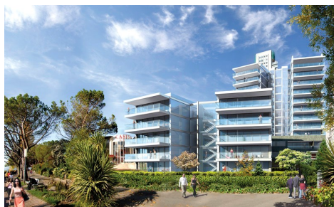
Image de synthèse

Construction de 2 immeubles d'habitation en PPE de haut standing, respectivement 10 + 24 appartement et 3 locaux commerciaux 1 parking public souterrain 45 places 1 parking souterrain 71 places pour la PPE. Amélioration du sol de fondation par pieux