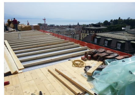
Isolation et réfection toiture