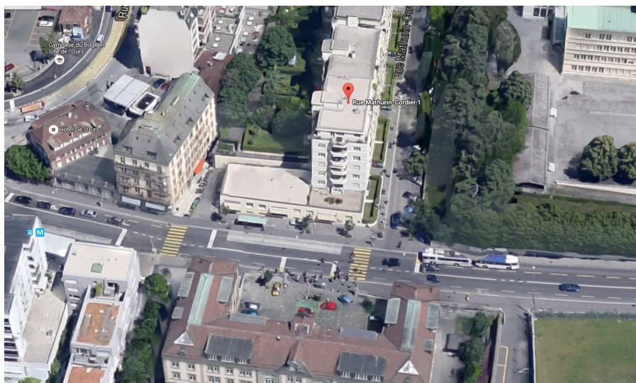
Immeuble façade Sud

Bâtiment occupés par locataires pendant les travaux durée des travaux