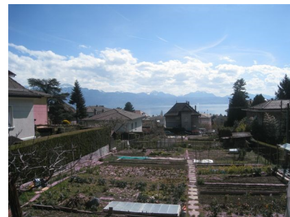
Terrain avant travaux