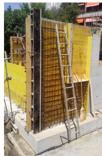
Bétonnage des murs

Une réalisation d'un atelier d'architecture indépendant, au service de ses clients