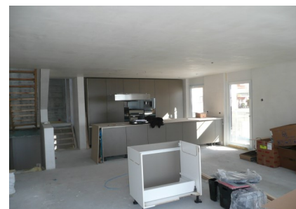
Aménagement de la cuisine