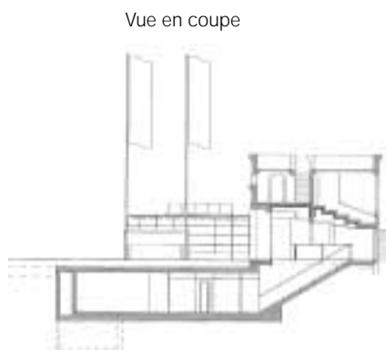
Vue en coupe